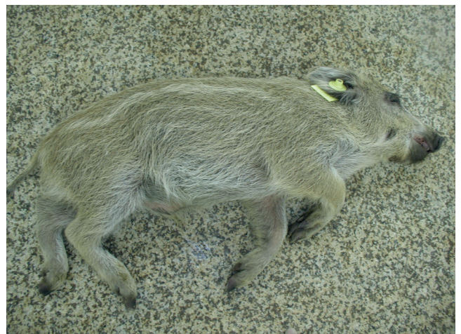
Abb. 5: Perakut verstorbener Frischling

Für den Antikörpernachweis in Serum und Plasma stehen mehrere, bisher in Deutschland nicht zugelassene ELISA-Kits zur Verfügung. Darüber hinaus können Antikörper mittels indirekter Immunfluoreszenz- oder Immunperoxidasetests nachgewiesen werden. Immunoblots werden ebenfalls eingesetzt. Probenmaterial der Wahl ist Serum.