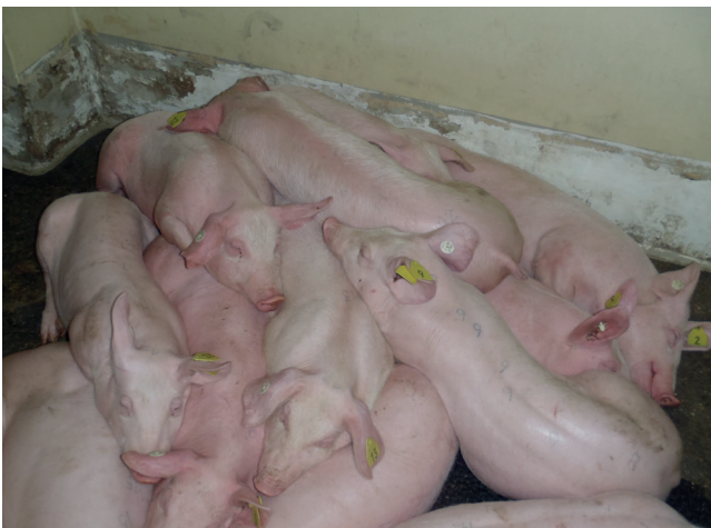
Abb. 3: Hausschweine mit hohem Fieber

Die Erkrankung ist auf der Basis klinischer Symptome nicht von der klassischen Schweinepest (KSP) und anderen schweren Krankheitsverläufen zu unterscheiden!