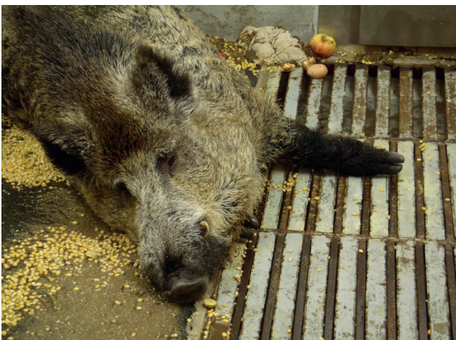
Abb. 4: Keiler mit unspezifischen Symptomen